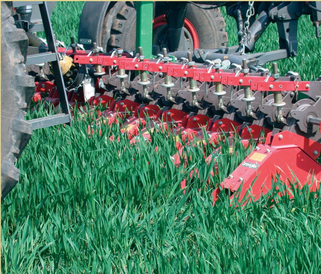
Rækkefræsning i vinterbvede