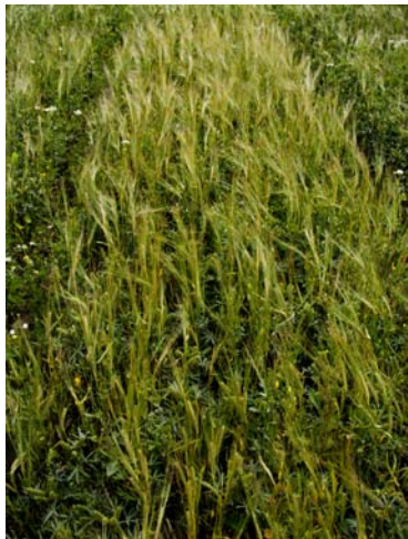
Vårbyg (cv. Otira) og lupin (cv. Prima) dyrket i 1:1 blanding på KVL 2001